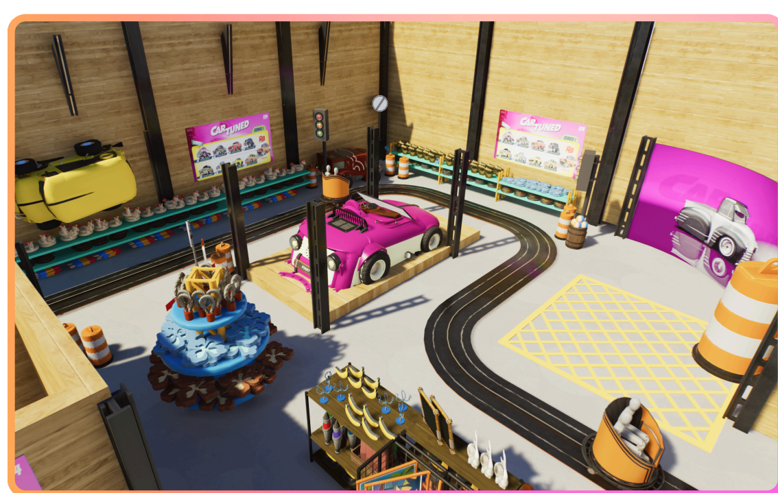
CarTuned x ToyChamp experience visual