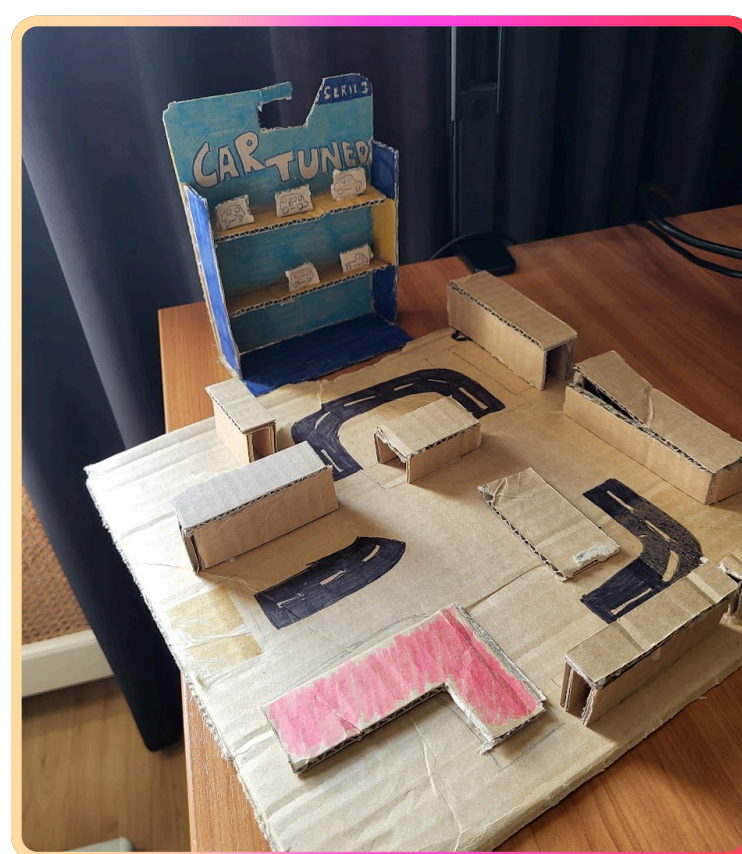
CarTuned x ToyChamp

Naast mijn organisatorische rol groeide ik ook inhoudelijk in het project. Ik werkte mee aan het doelgroeponderzoek, dacht mee over het aanscherpen van het concept, en droeg bij aan het uitwerken van het verzamelboekconcept. Toen de doelgroep het concept nog onduidelijk vond, hielp ik het idee concreter maken door het verhaal beter te structureren en het spaarmechanisme duidelijker te maken. Dit leidde tot het definitieve concept CarTuned x ToyChamp